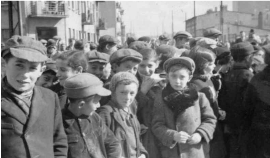
ילדים בגטו לודז' שבפולין