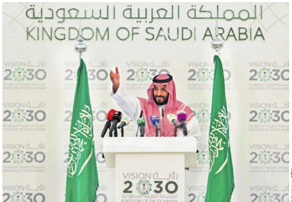
יורש העצר הסעודי מוחמד בן סלמאן ב-2016, בהשקת חזון 2030. תוכנית אסטרטגית, יעדים רב-שנתיים ומתווה ברור להשגתם

2 אין דרך אחרת להסביר את האובססיה לפטר את היועצת המשפטית לממשלה בזמן העברת תקציב המדינה בכנסת, ועוד לקשור בין שני הדברים. דמיינו רגע משקיע זר ששוקל להשקיע כאן. הוא בוחן את הפרמטרים המקרו-כלכליים של המשק הישראלי, ורואה שחרף המלחמה לא שקענו במיתון, ושיעור האבטלה יחסית נמוך, והשקל מתחזק מעט, והבורסה הישראלית מצמצמת את הפערים משאר השווקים. הוא גם רואה ממשלה שמתיימרת לנסות להקטין את הגירעון באמצעות העלאות מסים נרחבות. סביר שהוא יניח שאנחנו סוף סוף לוקחים את המצב ברצינות ומתחילים לשקם את הכלכלה. אבל אז הוא מגלה שחברי עוצמה יהודית מצביעים נגד תקציב של הממשלה שהם חברים בה כדי לרחוף לפיטורי היועצת המשפטית לממשלה, והאמון שלו שהתחיל להשתקם קצת הולך שוב לעזאזל. מה יקרה אם הממשלה באמת תפטר את היועמ"שית? האם ישראל תיהפך למקום שטוב יותר לחיות בו? למקום שבטוח יותר להשקיע בו? האם מיישהו שאל את השאלות האלה לפני שהמחלף התגלגל, או שאמרו – נחפור בור עמוק יותר הפעם ונראה מה קורה, אם המדינה תעמוד גם באתגר הזה? אז הם כבר בדרך לנסות לפטר את היועמ"שית, ואחר כך אולי ידיחו את ראש השב"כ, וימנו לתפקידים בכירים בשירות הציבורי רק את מי שנאמרים לשרים, וישלטו על המנגנון לבהירת שופטים, וישלטו, או גרוע מזה, את התקשורת החופשית. ח"כים מהקואליציה מקדמים חוקים שמרחיבים מאוד את סמכויות המשטרה, הגוף הראשון שעבר