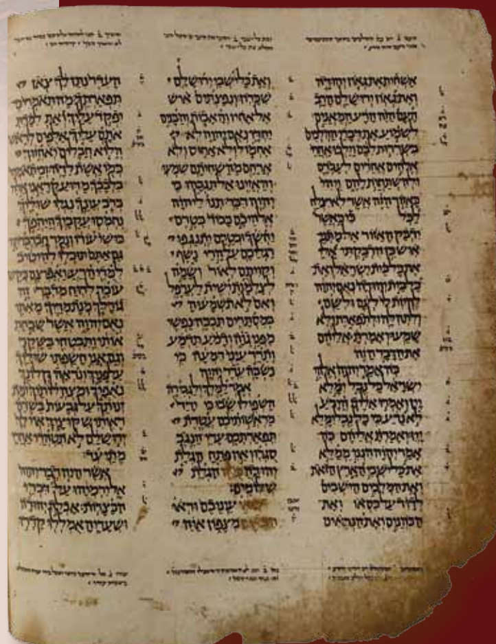
מזהרות צילום מפוארת בקופסא