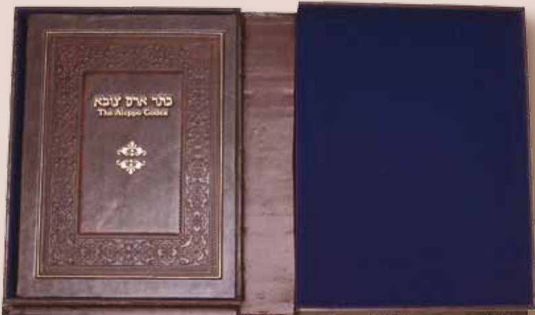
Deluxe Facsimile Edition With Box