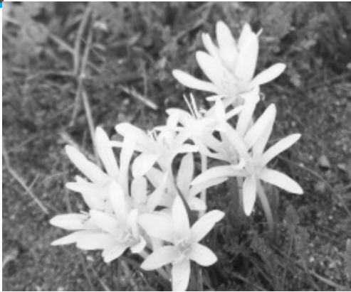
סתונית ירושלים