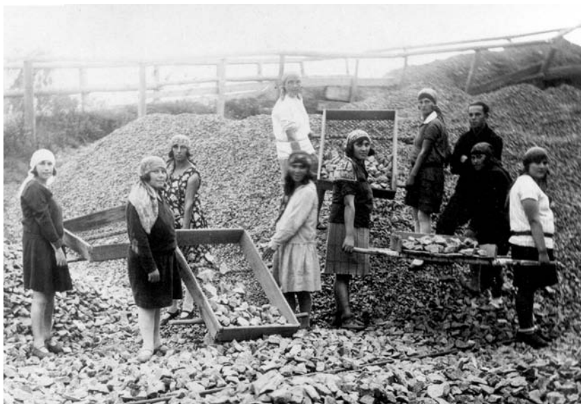
נשים עובדות בחצץ בקלוסובה, ללא תאריך.

גבוהים בחו"ל, ונראה כי זה היה הכיוון שהועידו גם לה. סיפורה של חייקה משקף את אופני הביטוי של קיבוץ ההכשרה כלפי הציבור, כלפי חוץ. הייצוגים התרבותיים שיצר ושבהם נתפס על ידי סביבתו היו מרכיב מרכזי בהווייתו. איזו משמעות ביקשו חברי הקיבוצים להציג כלפי סביבתם וכלפי עצמם? אילו סמלים עיצבה ההכשרה? המעשה ההצהרתי של חייקה — עבודת בניין בפרהסיה — ייצג באופן מוחשי את החזון הציוני של בניין מולדת על ידי יהודים ולמענם. הוא סייע לה לא רק לעזוב את בית הוריה, אלא גם להביא עמה שתי חברות לקיבוץ.