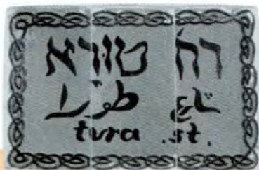
השלט של רחוב המלך ג'ורג'