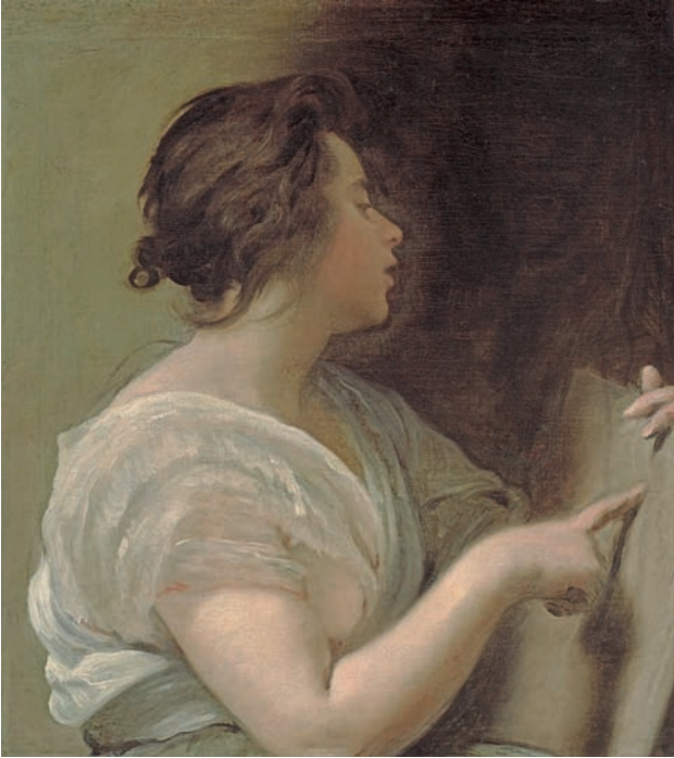
דימי 2. דיגו ולאסקז, "דמות נשית (סיבילה עם טאבולה ראסה)", 1648 לערך

או פלך אלא כשהיא אוחות בידה לוח ריק הנראה כבד ציור, שהיא ספק מצביעה עליו ספק תוחבת אצבעה לתוכו. בעוד "לאס מנינאס" הוא ציור של נראויות שכולל בתוכו את המתבונן, המהווה חלק מהמבנה הלולאתי של הציור, "לאס אילנדראס" משמר את אותו מבנה לולאה, אך הפעם לא רק בזכות פני השטח המצוירים אלא גם ובעיקר בזכות החומר שממנו הציור עשוי, החומר שלתוכו ארכנה תוחבת אצבע. כעת הלולאה אינה כוללת רק את המתבונן שרשום בציור, אלא הציור עצמו, כאובייקט ממשי, הוא חלק בלתי נפרד ממה שמצויר בו.