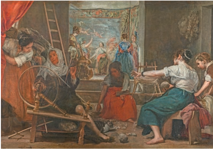
דימוי 1. דייגו ולאסקז, "לאס אילנדראס" (הטווות, או סיפורה של ארכנה), 1655–1660

תחילה נתפס "לאס אילנדראס" כציור ז'אנר המתאר אורחות חיי יומיום בסדנת אריגה, שברקע שלה נראה חדר תצוגת השטיחים הגמורים. אולם הכותרת הנוספת של הציור, "האגדה על ארכנה", מציעה כי הציור מתייחס למיתוס כפי שמתאר אותו אובידיוס. ולאסקז, נאמן לפרשנות של אובידיוס לסיפור המעשה, מצייר בקדמת המרחב את ארכנה לא ברגע המפלה אלא בשיאה של התחרות. בחדר הפנימי שברקע אפשר לראות את השטיח שארגה, שבו מתואר אונס אירופה, לפי ציורו של טיציאן לסיפור. דמותה של ארכנה מצוירת בקדמת השטיח התלוי, ספק כדמות ארוגה בתוכו ספק כדמות ממשית המתעמתת עם פאלאס, המצוידת בבגדי הלוחמת שלה, לאחר שהסירה מעליה את תחפושת הקשישה. אפשר להניח כי ריצודו של הדימוי בין ציור על שטיח ארוג ובין ייצוג של דמות ממשית במרחב הציור משמעו שהדימוי החזותי, לפי ולאסקז, אינו נבדל ממראה מציאות. במילים אחרות, עבור ולאסקז, ועבור אובידיוס לפניו, המיתוס על ארכנה אינו עוסק בחטא היהרה דווקא אלא באמנות עצמה וביכולותיה יוצאות הדופן של האמנית. אך מעבר לכך, ולאסקז